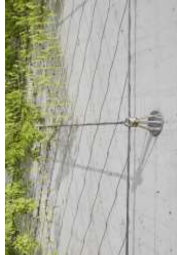
ChuanChuen Park On-nut