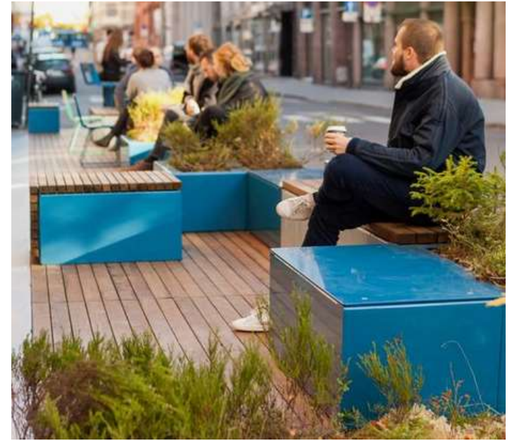
Mobilier urbain - Architonic

Centre ville d'Epinay-sur-Seine – La compagnie du Paysage