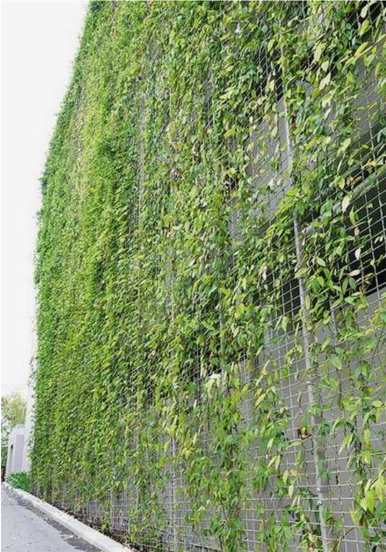
Groene wand (klimplanten).